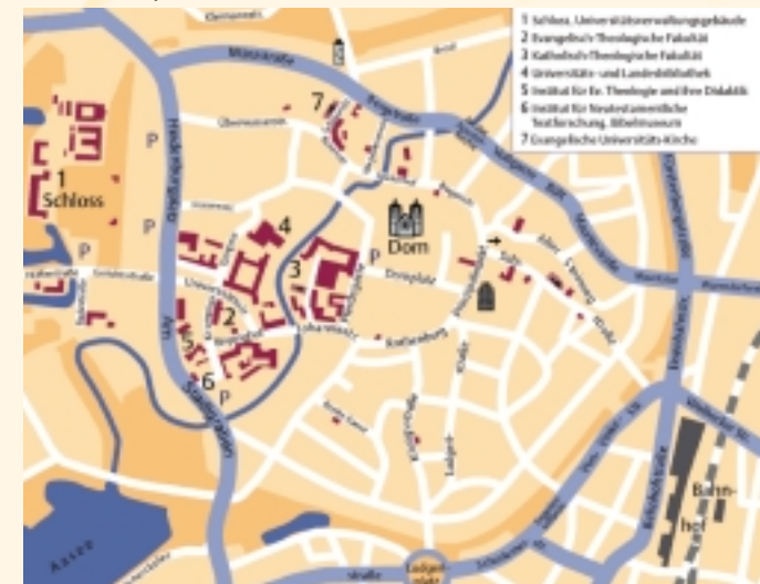
Grafik: Ursula Dey